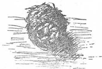
Poppenhuisje van den gouden tor ( cetonia metallica ) door de mieren gebezigd als kinderkamer (natuurlijke grootte).

’t Was in 1911 dat ik er, in ’t buitengoed der Eerw. Paters Jezuiten te Turnhout, voor ’t eerst kennis mee maakte. Daar leefde een – voor onze Kempenstreek – reuzenkolonie van formica rufa . Louter toeval leidde tot die ontdekking. Op zoek naar andere dischgenooten der mieren, groeven we plots een paar mooie ronde bollekes uit, ongeveer zoo groot als ’n noot. Ze waren door de zorgzame mieren in huur genomen om er ’n partij poppen in onder te brengen; bij nader onderzoek bleken het verlaten cocons te zijn waarin weleer ’n grooter insect op zijn verrijzenis wachtte. De wetenschappelijke Scherlock Holmes had ’t spoor gevonden van een onbekende, dien hij kost wat kost zou opsporen. En of er gegraven werd van onze kant... en gespoten door de met reden verbolgen mieren! We wrochten in een echte wolk stinkende gassen, we waren verzadigd van mierenzuur. De hoopvolle verwachtingen, die we koesteren, werden echter bitter teleurgesteld. Slechts een handvol drekkamers, met spelden en overschotjes van ’t mierennest ingewerkt, werden opgegraven, evenals de eerste verlaten kluizen, die geen verder licht wierpen op ’t onderzoek.